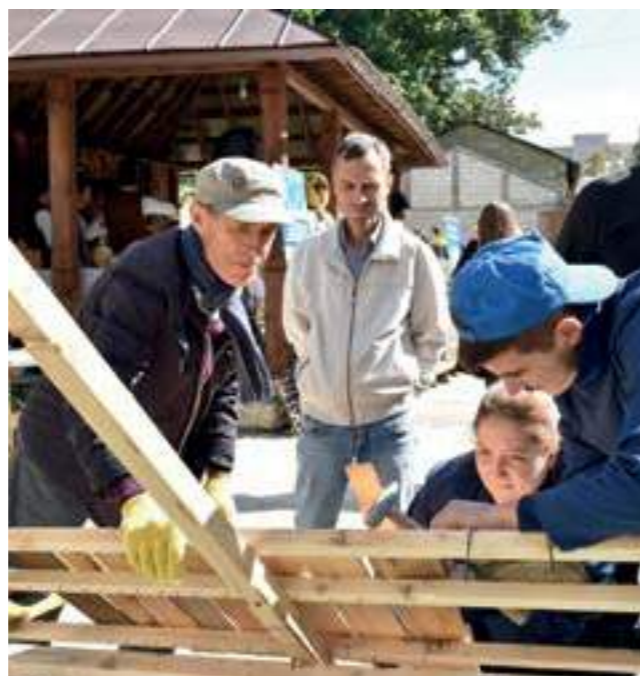
„Фолклорната традиция в музея – от нематериалното към материалното“; как се прави гървен покрив, Кишинев, 2018 г.

Чишинау/Кишинев, 14-15 февруари 2019 г. „Семинар, посветен на стратегиите за съставяне и актуализация на Индикативния списък на Република Молдова за Световното наследство на ЮНЕСКО“. Семинарът е част от по-голям проект, финансиран от Европейския съюз, наречен „Подкрепа за популяризирането на културното наследство в Република Молдова чрез неговото опазване и съхранение“. Участниците имаха възможността да се поучат от опита на няколко национални експерти – Георге Пощикъ, Сертиус Чокану, Сергиу Муцияцъ, и чуждестранни експерти – Мишел Ком – Франция, Русудан Мирзикашвили – Грузия, Ирина Ямандеску, Валериу Каврук – Румъния, относно съвременните подходи при опазването и оползотворяването на културното наследство. Дейностите в рамките на семинара имаха за цел да привлекат вниманието върху някои ценности от природното и културно наследство на