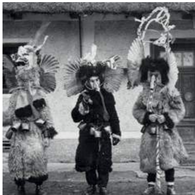
Група Куренти, Марковци, 1963 г.

На Втората обществена дискусия присъстваха