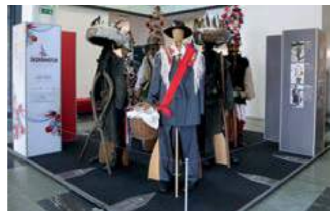
Изложбата, 2019 г.

Other carnival figures are: Turk , the bride and Groom, Marko the Bear and the Master, the Fat one, Gypsy man and woman, the Green ones, the Musicians, the Devil, the Tinker, the Hunter, the Dead one carrying the Liv-