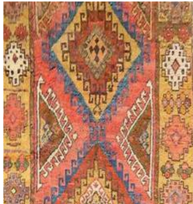
Килим с ромбоиден мотив, Кесария-Нигдже, начало на XVIII в. Rug with a diamond pattern, Kesaria-Nigde beginning, of XVIII c.

Важно е да насочим вниманието си към взаимовръзките между Анадола и Кавказкия регион в тъкането на килими. По отношение произхода на килимарската култура, какви са били взаимоотношенията между такива крупни центрове на килимарското производство като Кавказ и централните области на Мала Азия, най-вече Себастиа, Кесария и Икония? Разпространение