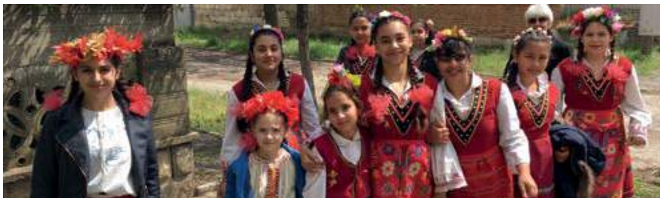
Лазаруване, с. Иваново, обл. Русе, 2019 г.