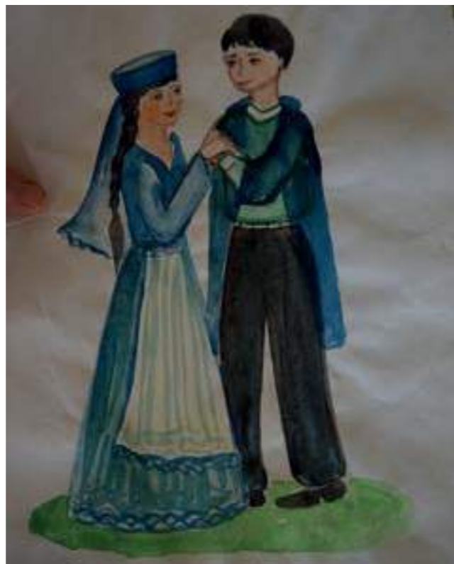
Детска илюстрация към книгата „Нека звучат майчините езици“, 2019 г.

Понастоящем, съвместно с нашите партньори – Мелитополския държавен педагогически университет „Богдан Хмельницки“, Центъра за развитие „Демокрация чрез култура“, Регионалния методически център за култура и изкуство на Запорожието, и с подкрепата на Културния отдел на Градския съвет в Мелитопол – ние реализираме много събития, насочени към изучаване и популяризиране на нематериалното културно наследство, и то не само на Караимите. Това доказва, съответно, и неотдавнашният семинар по езиковите въпроси, на който много лектори разказаха за езика като носител на нематериалното културно наследство.