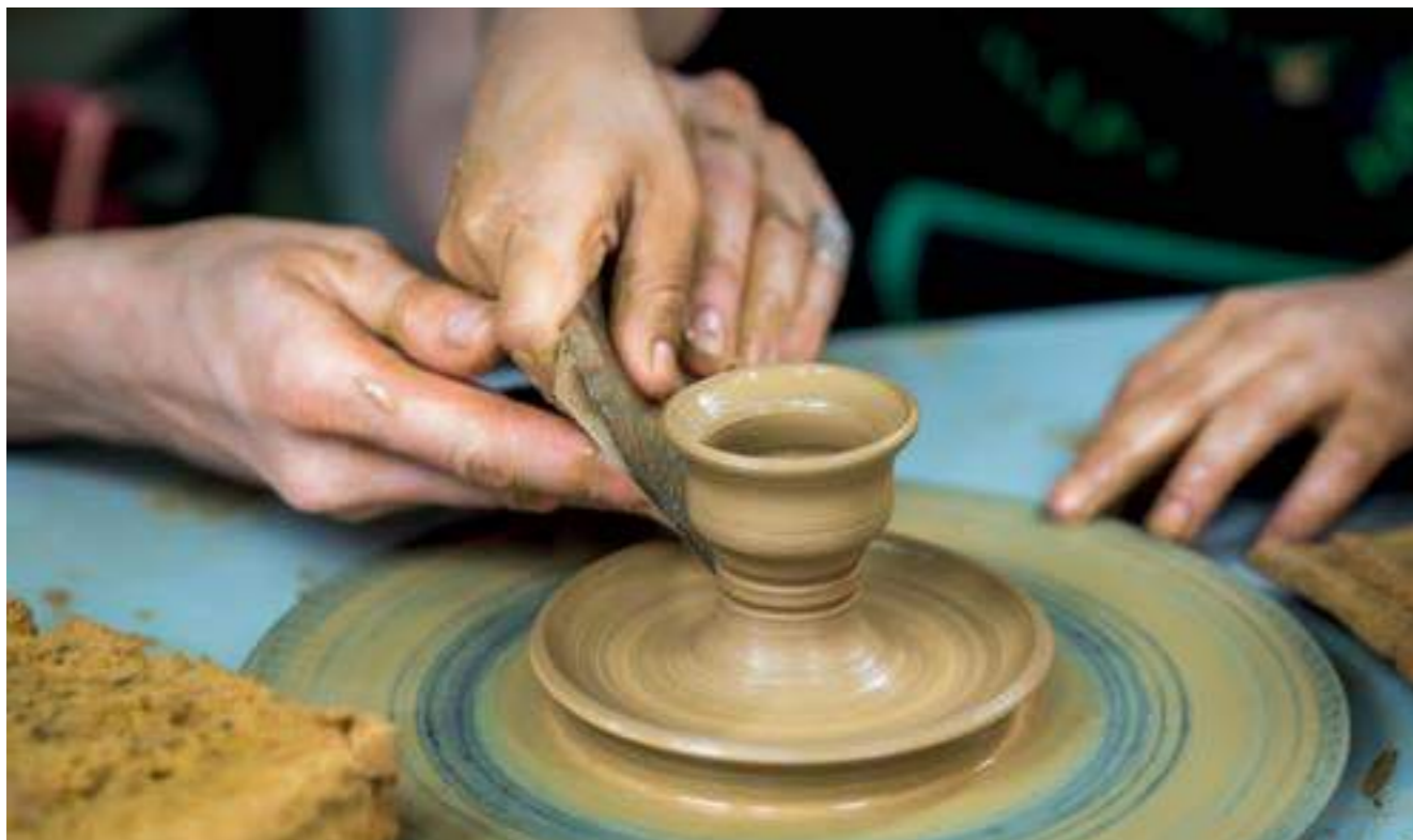
Седмица на традиционните занаяти, РЕМ Пловдив, 2019 г.

Traditional crafts week, REM Plovdiv, 2019