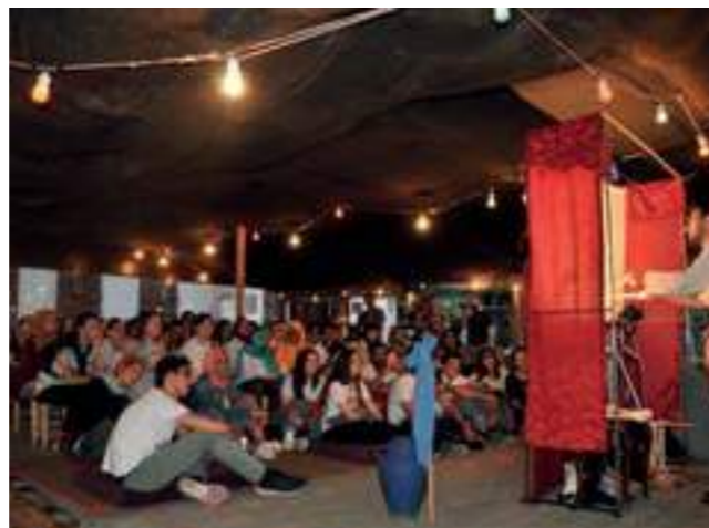
Карагюз, вид театър на сенките, представен пред чуждестранни посетители на Музея в Анкара