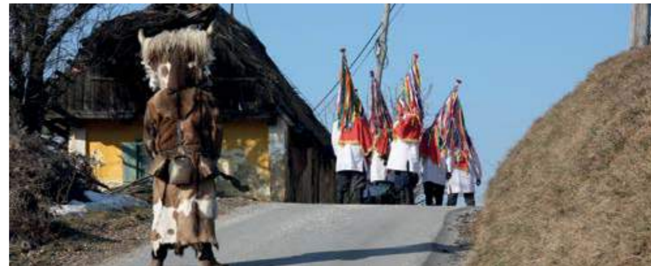
Група празнично облечени орачи с курент, Мали Окич, 2012 г.

longer compete in being ugly but in being beautiful”. The intangible heritage is subject to ever changing processes, and logically called living intangible heritage. In the case of Kurenti this finds expression in their appearance, in the participation of married men and children, of women who nowadays wear special attire, as well as in the performances outside the primary environment and during carnival season. Kurenti have been striving to look nicer – quite often resembling each other – since the sixties of the 20th century. They have been greatly influenced by Kurentovanje festival in Ptuj ( called