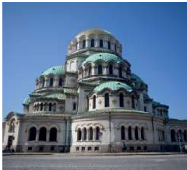
Патриаршеска катедрала „Св. Александър Невски“, София, 2019 The St. Alexander Nevsky Patriarchal Cathedral, Sofia, 2019

Всяка приказка обаче има своя край. Фердинандовата епоха свършва внезапно в катастрофата на Първата световна война, когато коалицията на Централните империи, част от която е и България, рухва, за да възвести началото на една напълно нова прогресивна епоха, в която историята ще се ръководи не от царе и императори, а от народа. Времето на пищните аристократични архитектурни стилове приключва.