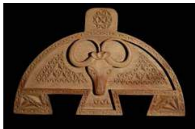
Амулет срещу уроки, букво гърбо, XX в., Ереван, Армения, 2018 г.

Amulet- against evil eye, beech, XXth century, Yerevan, Armenia, 2018