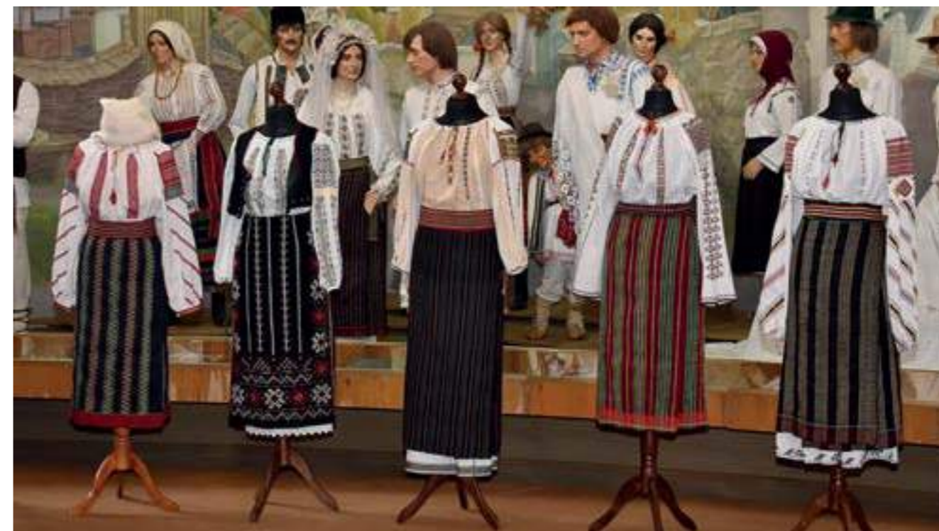
Традиционни народни костюми от изложбата „100 бесарабски ризи, спасени от изгубване“, Кишинев, 2019

March 26 – May 17, 2019, Madrid, Spain. The Exhibition. “The Image of the World Woven in Wool. Traditional Wall Carpets and Textile Industry Implements from the Collections of the National Museum of Ethnog-