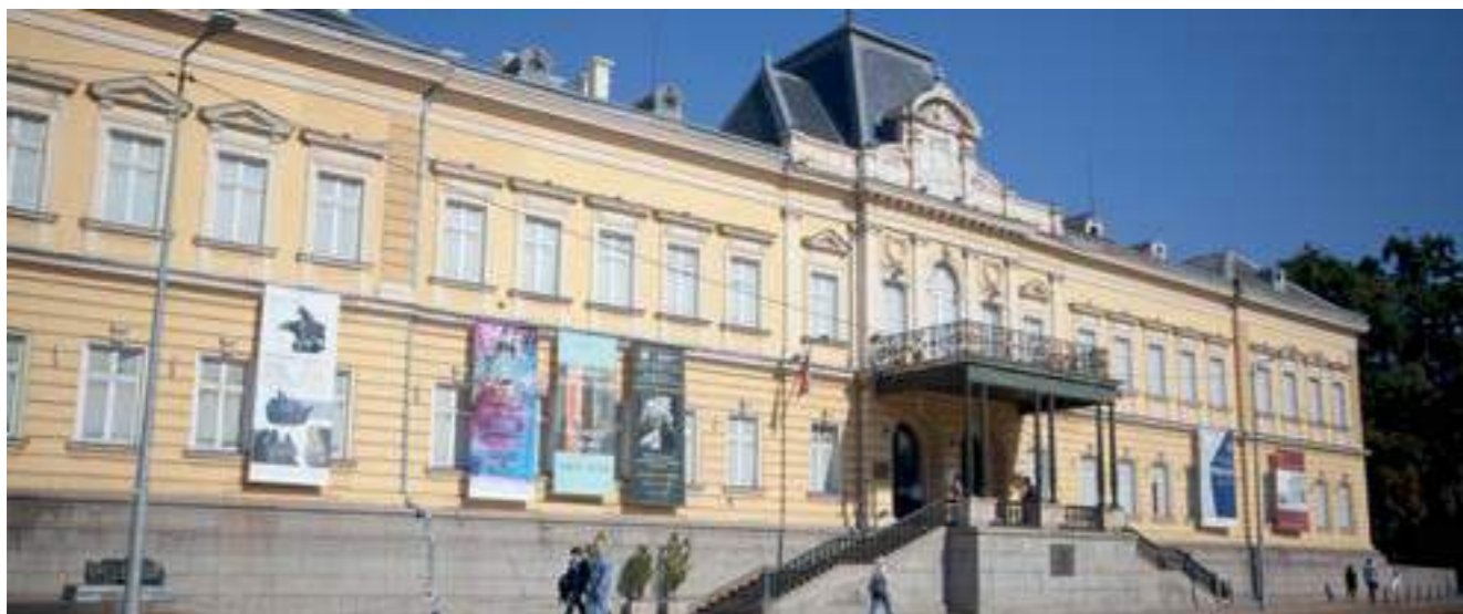
Национална художествена галерия, София, 2019

Built at a crossroads between civilizations, in a region of rather turbulent political history, Bulgaria does not have that many well preserved architectural monuments pre-dating the 19th century to boast of. This places one of the oldest states in Europe in the paradoxical situation of having lost its tangible, material connection with the past, to the extent that Bulgaria has such a connection at all, or it is rather imaginary and based not on authentic but