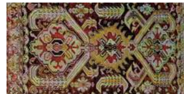
Килим със змей „Джраберд“, Спарта-Нидже, XVIII в. (Мъри Ейланд, фиг. 293)