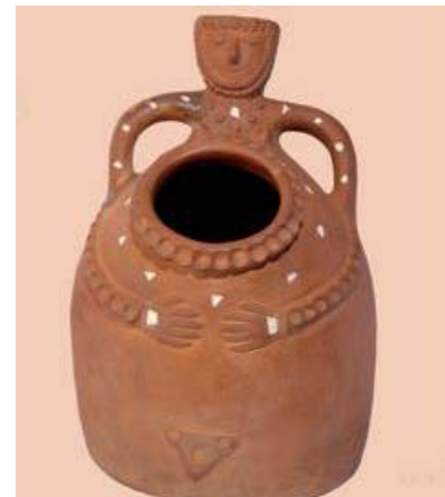
Солница във форма на женско тяло, глина, XX век.