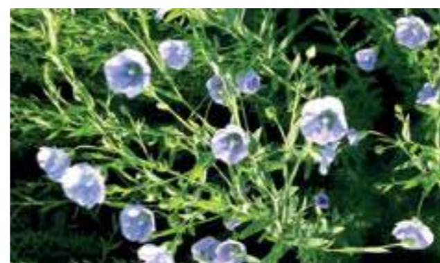
Цъфнал лен, Кролевец, 2019