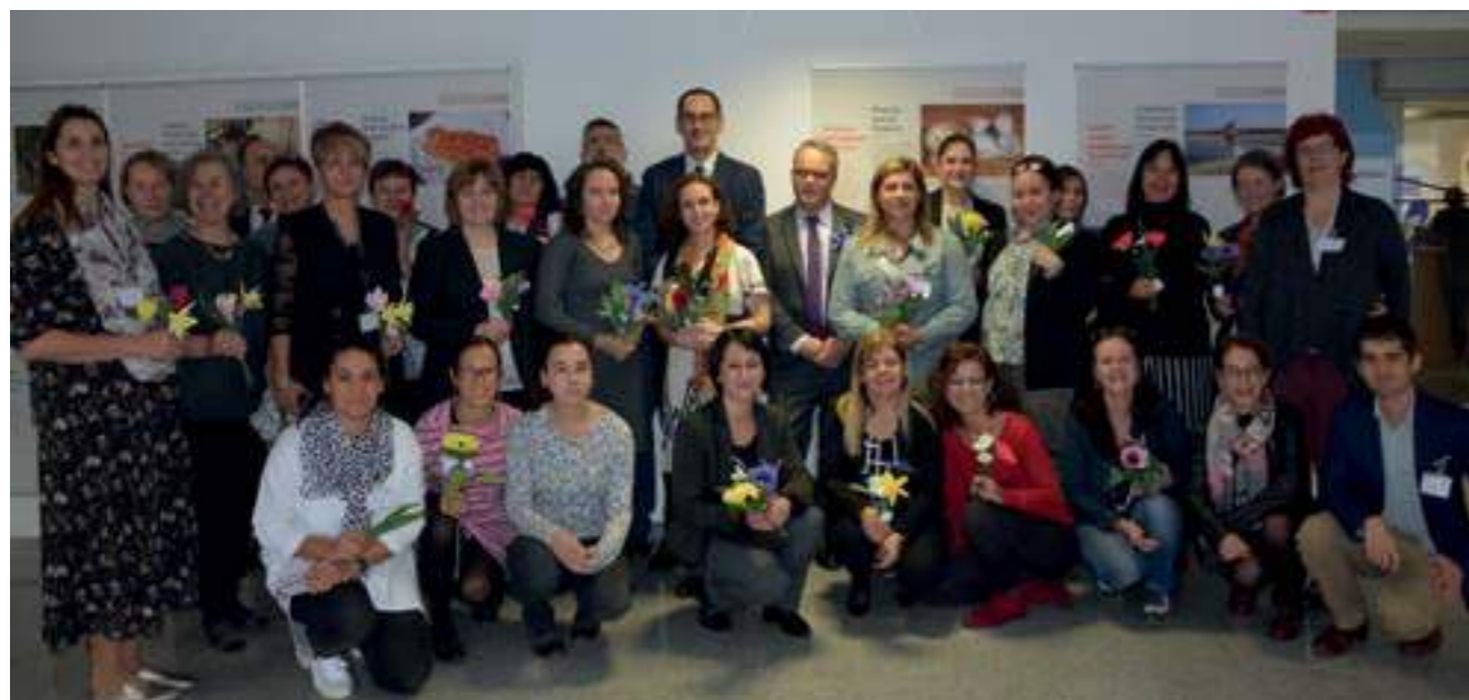
Участниците в Срещата в Любляна, Словенски етнографски музей, 2018

As usual, the last day of the meeting was dedicated