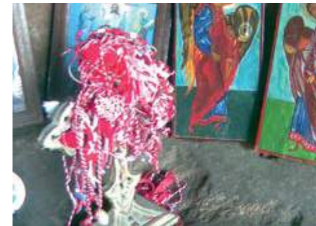
Мартеници върху напрестолен кръст. Скална църква, Магара, гр. Шумен, 2019

The setting of the museums changes rapidly, raising fresh challenges to their continued successful existence. Advances in technology, which facilitate access to the heritage using digital devices and educational trends breaking traditional molds, threaten the very existence of those institutions that fail to adapt. The cityscape in which the