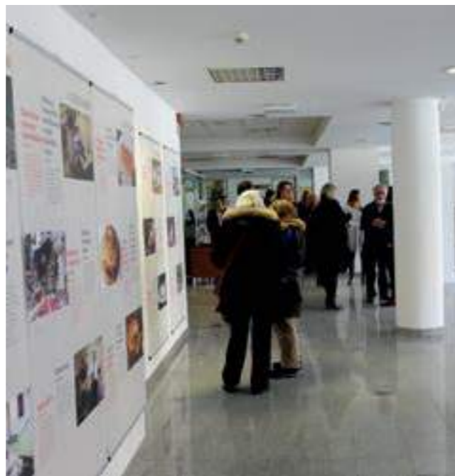
Откриването на изложбата, 2018