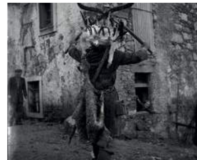
Шкопит, село Хрушица, 1962

Най-ранното споменаване на обичай, подобен на Шкороматия, е от 1340 г. и се намира в архивите на градеца Чивигале дел Фриули, недалеч от Удине (Италия), където по онова време е било забранено да се носи костюм на scaramatte по Сирни Заговезни. Смята се, че думата scaramatte, или sgaravatte, произхожда от немското Scharwächter, което озна-