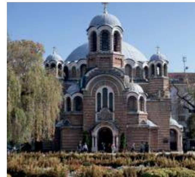
Черква „Св. Седмочисленици“, София, 2019

The Church of the Seven Holy Apostles, Sofia, 2019