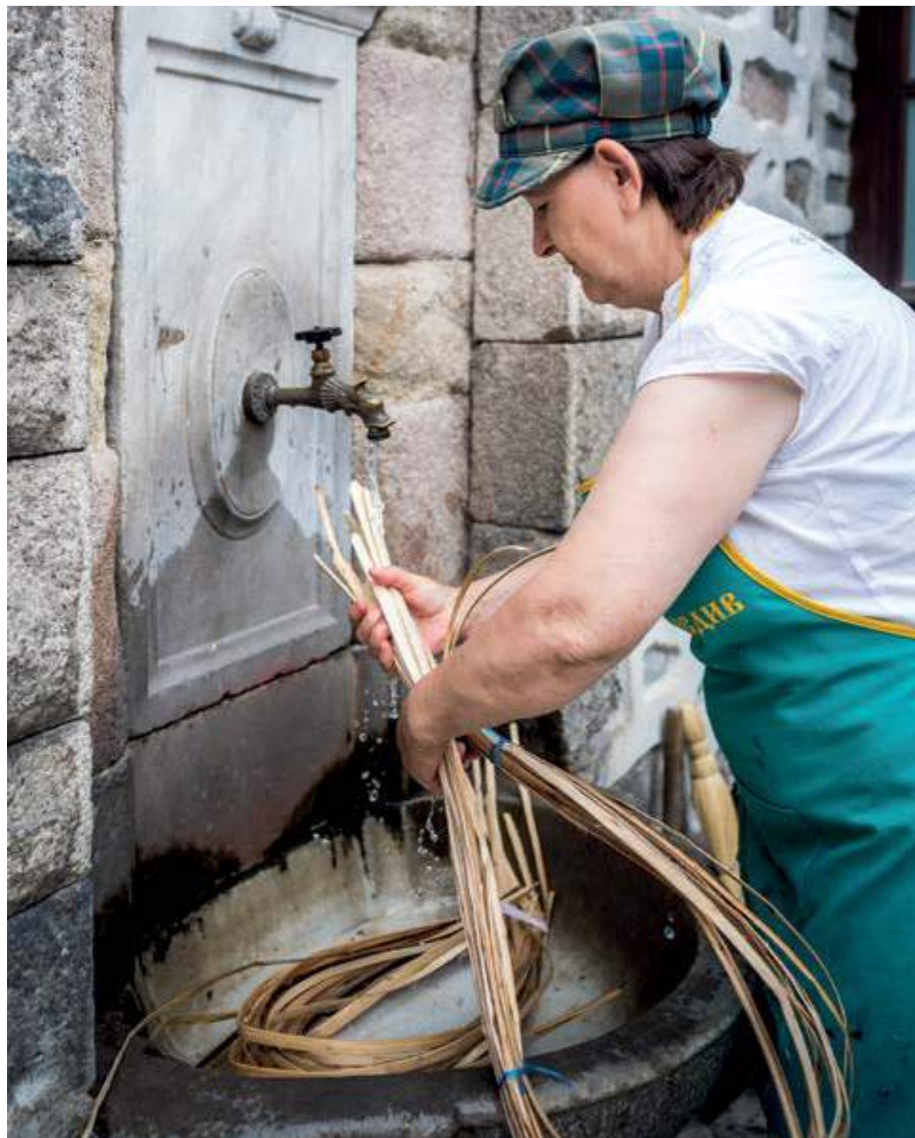
Седмица на традиционните занаяти, REM Пловдив, 2019 г.

Traditional crafts week, REM Plovdiv, 2019