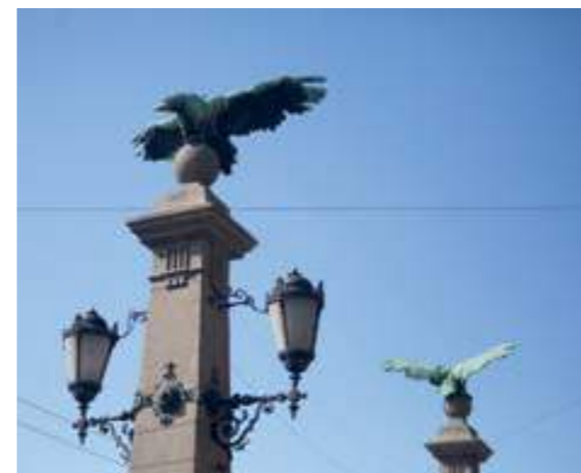
Елемент от Орлов мост, София, 2019

rather, on restored and to some extent falsified architectural monuments and buildings. And yet, the above observation does not include the past one hundred and fifty