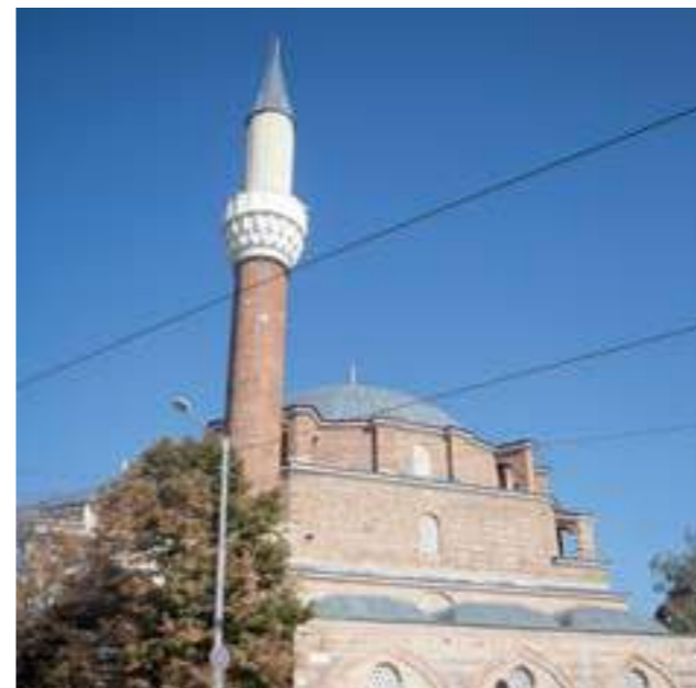
Баня Башу гжамия, София, 2019