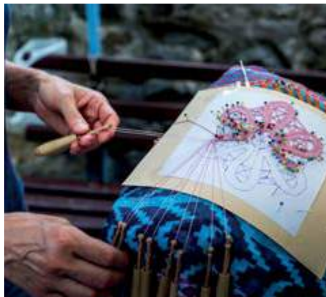
Седмица на традиционните занаяти, РЕМ Пловдив, 2019 г.