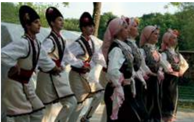
Фолклорен танцов състав „Найден Киров“, Русе, 2018

The Nayden Kirov folk dance ensemble, Russe, Russe, 2018