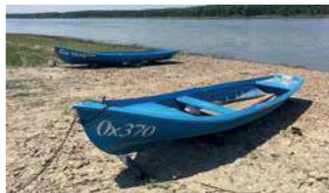
Дунавският бряг с рибарски лодки, Оряхово, 2019 The bank of the Danube with fishing boats, Oryahovo town, 2019

Living heritages constitute an important part of museum representations. They bring expositions to life, add meaning to artefacts, place in context locations and attributes, people and skills. It is in the process of defining the regulation of living heritages that a set of interrelations are created. They subsequently impact both the museum institution and the actual registered elements of the heritage as part of the sustainability of the practice. Their presence in the expositions comes as evidence of the leading role of the institution, which manages not only to identify those specific heritages but to find partners and 'co-conspirators' in the efforts pertinent to the registration, the necessary means for safeguarding of the relevant elements and the building of a sound system for the transmission of knowledge.