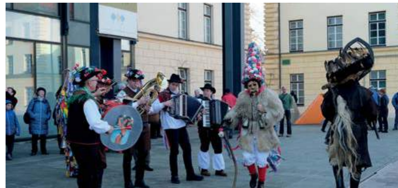
Откриването на изложбата, 2019 г.