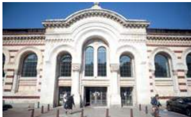
Регионален исторически музей (бивша минерална баня), София, 2019

Може би няма по-подходящ стил от историцизма за изграждането на първите, натоварени с