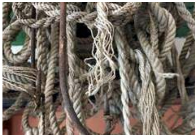
Въже с куки „кармаци“ за улов на есетри, с. Долни Вадин, обл. Враца