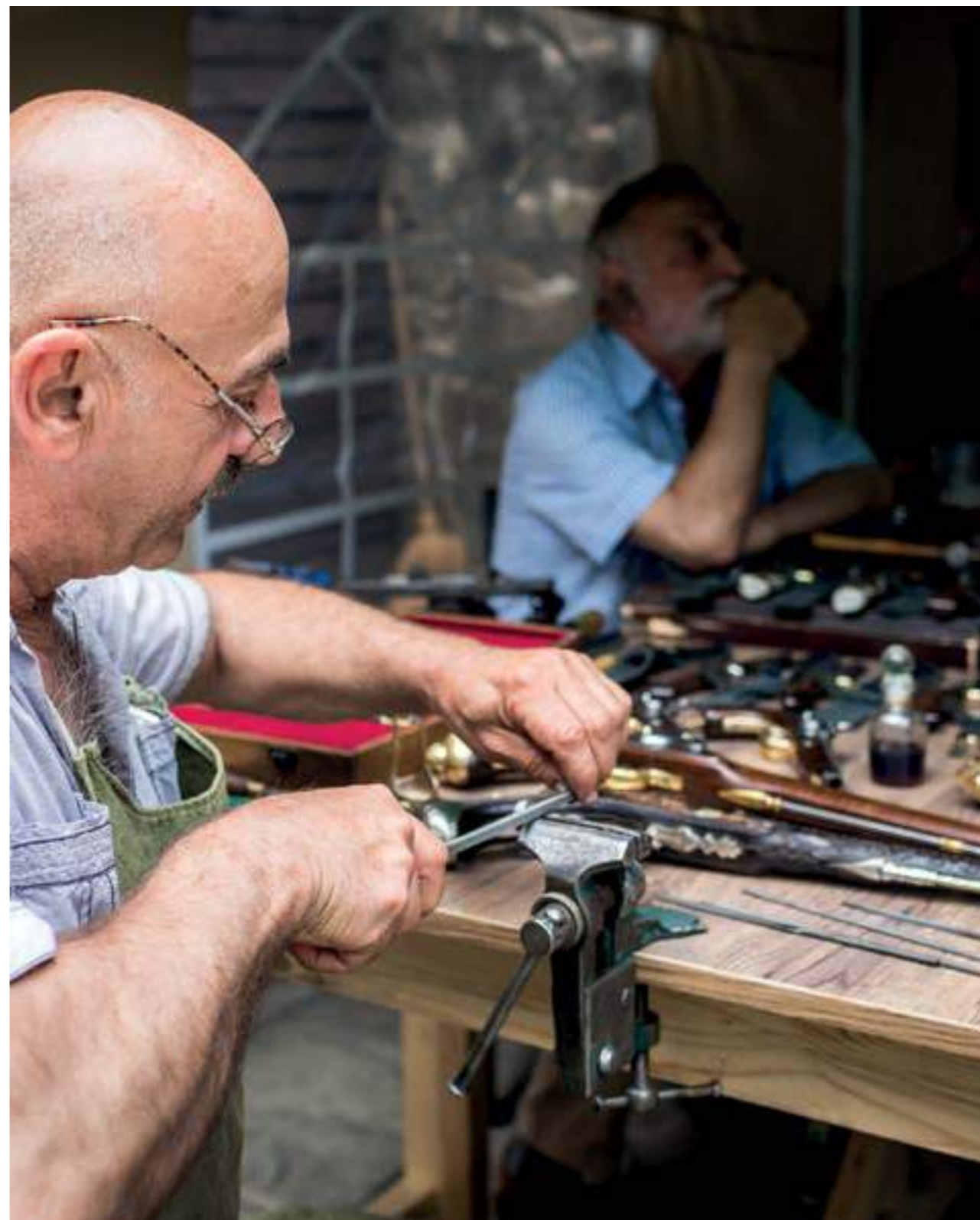
Седмица на традиционните занаяти, РЕМ Пловдив, 2019 г.

Traditional crafts week, REM Plovdiv, 2019