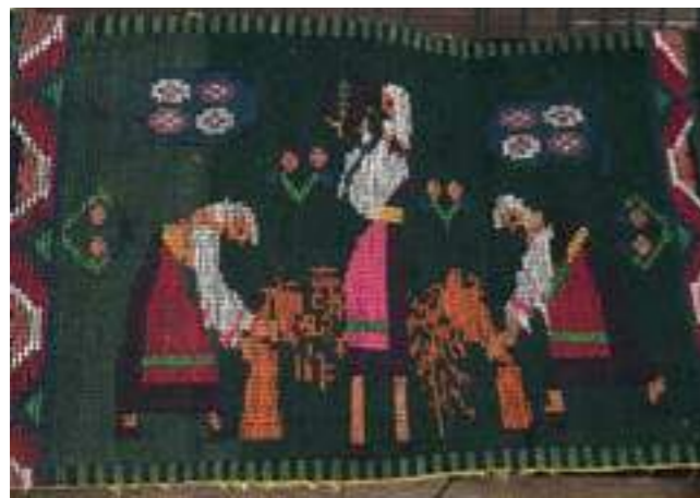
Възглавница, традиционна техника: „Жътва“, 30-те г. на ХХ в., с. Иваново, обл. Русе

Пиранска сол. В Порторож, Словения, при бивши склад за сол (Nekdanje skladišče soli Monfort) на брега на Адриатическо море, е създаден музей на солницата,