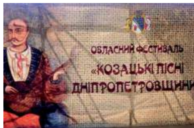
Плакат на Третия регионален фестивал на казашката песен от региона на Днепропетровск.

The 3 rd Regional Festival Cossack songs of Dnipropetrovsk Region was held on June 8, 2019 . It was organized by the Regional Association of Local Self-Governments and Department of Culture, Nationalities and Religions of Dnipropetrovsk Region State Administration. At the practical workshop the local community from the village of Bohuslav shared their experience