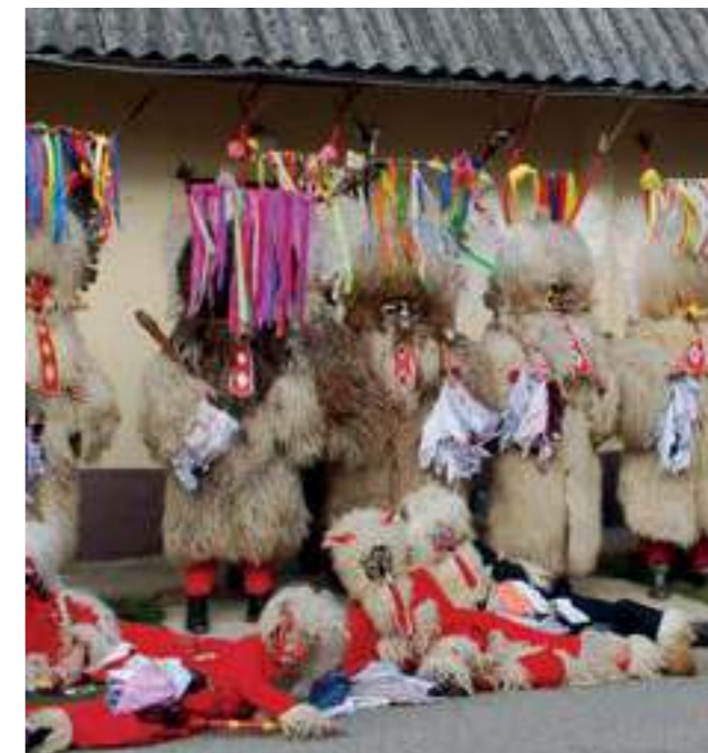
Група Куренти, Марковци, 2016 г.