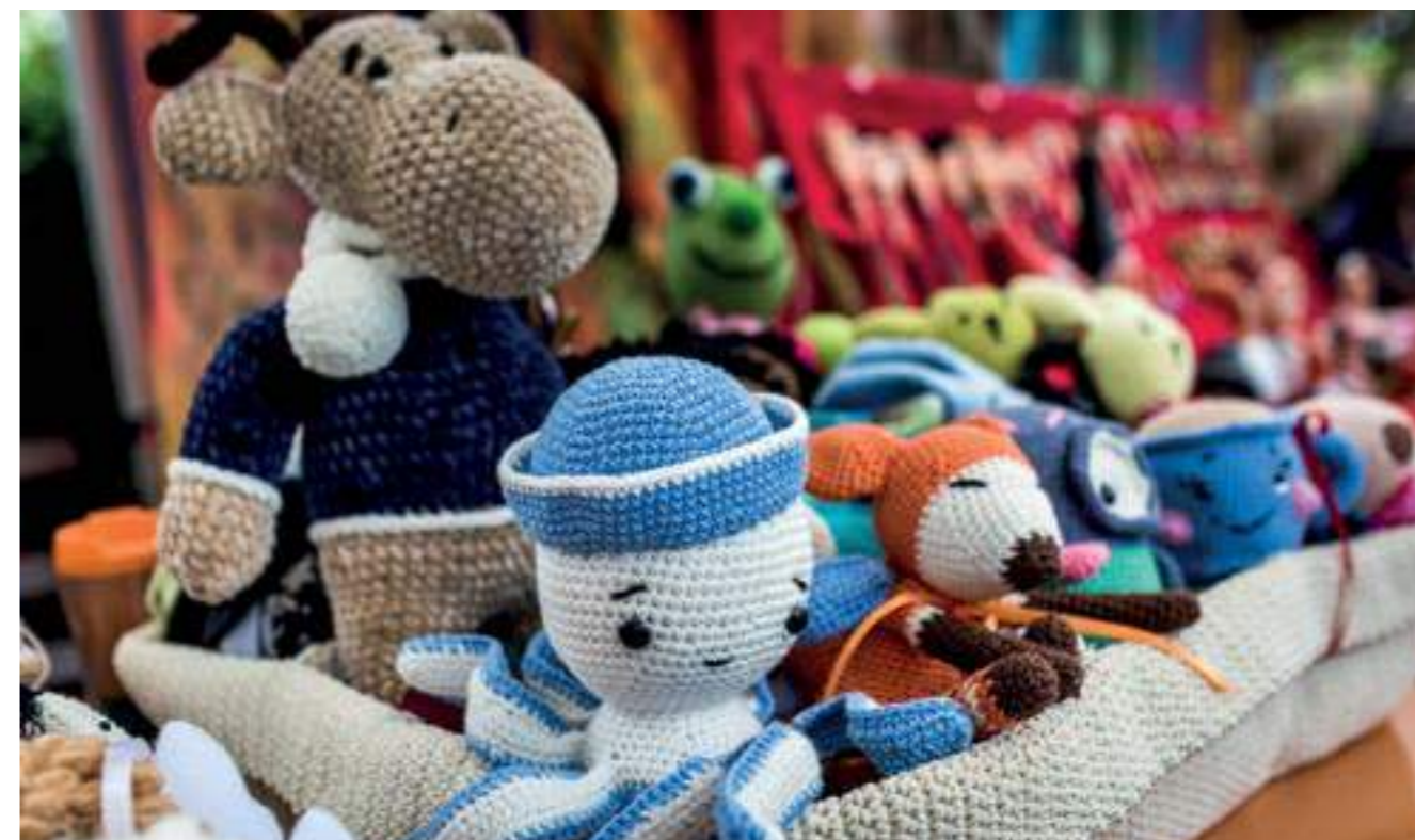
Седмица на традиционните занаяти, REM Пловдив, 2019 г.