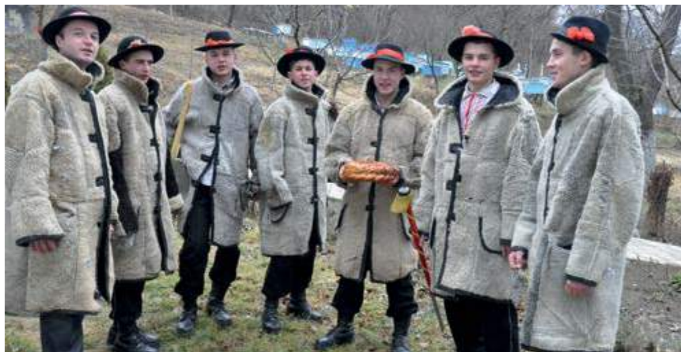
Изпълнители на коледни песни на Празника на коледарите — манастир Циганеци, Молдова, 2012 г.

traditional , encountered in the title of several chapters of the Inventory, suggests that the Intangible Cultural Heritage comprises creations of the traditional village society, that are orally transmitted from one generation to another, maintaining their viability up till now. In order to illustrate the living Intangible Cultural Heritage elements from Moldova, we shall cite one for each chapter of the Register: “Repertory of fairy tales (fantastic, novelistic or about animals) with the regional names attributed to them” (I.1), “Carols performed by children: on Christmas Eve or on Christmas day”, “Songs interpreted by children marching with a star” (II.1), the traditional dance “Fusul” (III.1), “Leaf” as a musical instrument (IV.1), “St. Andrew – Beginning of winter, with augural and premarital practices (guarding the garlic and similar ones)” (V.1, “Descvntatul (charms) as a complex of psycho-therapeutic methods, based on speech therapy with phyto-therapeutic, psycho-hypnotic (magic) and bioenergtical ways of healing” (VI.1), “Bread and bread recipes” (VII.1), “Knowledge of the properties of wood essence and its use, maintenance and preservation of wooden objects” (VIII.1), “Family together with