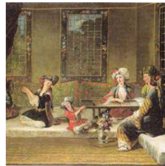
Жан-Батист Ван Мур. «Арменски жени бродират в един от султанските дворци». Масло, холст, 44 x 62 см

„Арменски жени бродират в един от султанските дворци“, платно на Жан-Батист Ван Мур, датирано около 1710-1720 г.