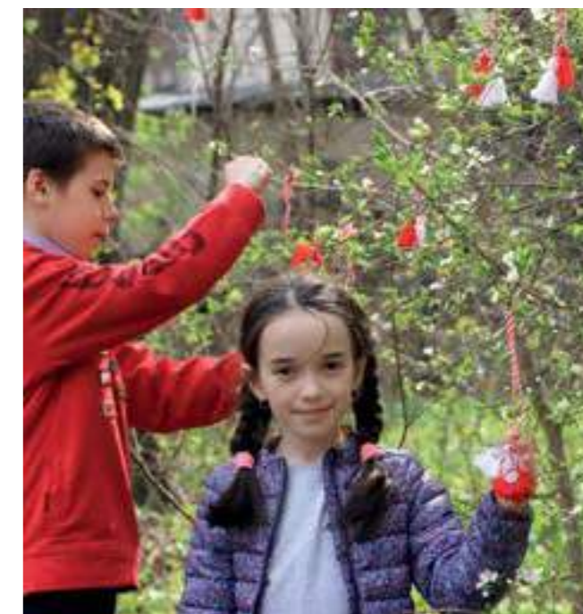
Деца завръзват мартениците си в Националния етнографски и природонаучен музей, Кишинев, Молдова, 2019 г.

• Traditional Wall Carpet Craftsmanship in Romania