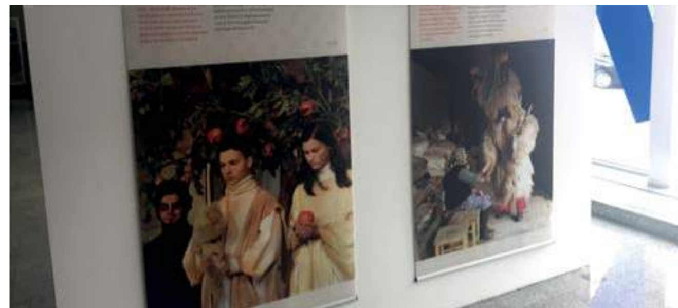
Пътуваща изложба „Нематериалното културно наследство на Словения в светлината на конвенцията на ЮНЕСКО“

Travelling Exhibition „Intangible Cultural Heritage in Slovenia in the Light of the UNESCO Convention“