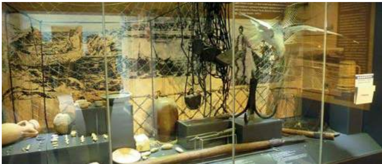
Музей на дунавския риболов и лодкостроене, Тутракан, 2018. Danube Fishing and Boatbuilding Museum, Tutrakan, 2018

Включване в съвместни дейности. Предимство на музейната околна среда е, че чрез дигитално съдържание обединява материално и нематериално културно наследство – предоставя достъп до артефакти, но и до техния контекст, който може да бъде непознат, неосезаем. По този начин музеят изважда на показ важни за съвременността елементи на наследството и онагледява промените, настъпили в резултат на промяната в културните практики за съхраняването и споделянето му.