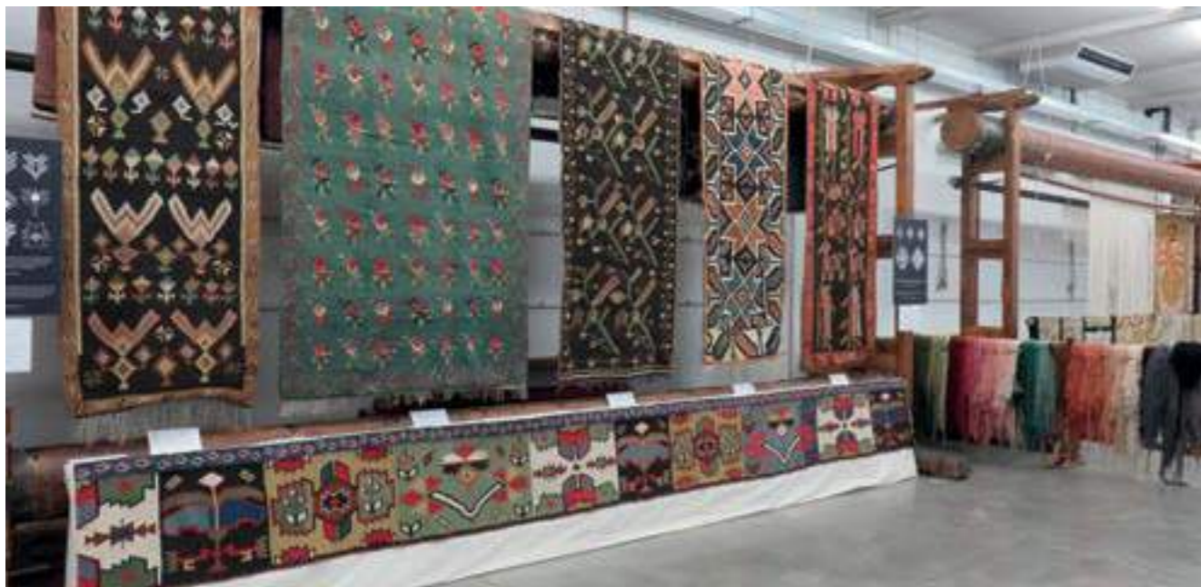
Изложбата „Образът на света, изтъкан от вълна“, Мадрид, 2019 The Exhibition “The Image of the World woven in Wool”, Madrid, 2019

и др. от Република Молдова, както и инструменти и пособия, използвани в преработването на вълна и в тъкаческия занаят. С помощта на музейни експонати и снимки посетителите имаха възможност да се запознаят с основните етапи от създаването на традиционните бесарабски килими. Изложбата бе средство за популяризиране на досието „Традиционното майсторство при изработването на стенни килими в Румъния и Република Молдова“ – елемент на нематериалното културно наследство, който вече е вписан в Представителната листа.