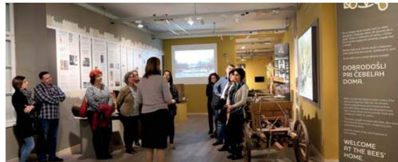
Изложба „Там, където пчелите се чувстват у дома си“ в Словенския етнографски музей, 2018 г.

Exhibition "Where Bees Are at Home" at the Slovene Ethnographic Museum, 2018