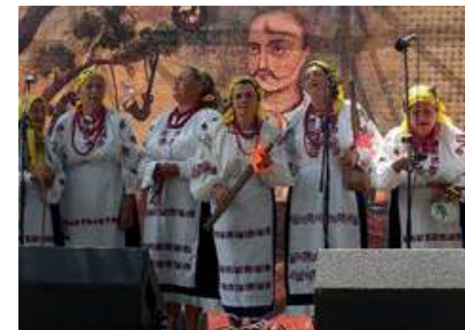
Трети регионален фестивал на казашката песен - Днепропетровск 3rd Regional Festival Cossack's songs - Dnipropetrovsk

On April 24, 2019 , the Round Table Ukrainian Pysanka: Tradition and Art , organized by the National Union of Folk Art Masters of Ukraine, the National Academy of Arts of Ukraine and the Development Centre “Democracy through Culture” was held in the National Union of Folk-Art Masters of Ukraine (Kyiv). Researchers, experts and artists discussed the role of Ukrainian pysanka tradition in modern culture through alloying high art of pysanka painting and national customs. It is an undoubtedly unique phenomenon of the living culture