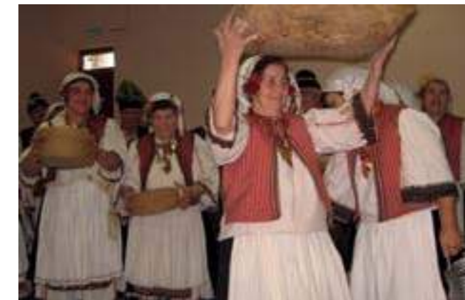
Благославяне на обреден хляб в нощви, етнографска група „Капанци“, гр. Разград, 2019

Museums ensure the viability and durability of the intangible cultural heritage through informal education by means of the discipline of museum pedagogy. It is instru-