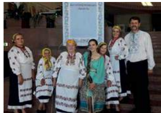
Фолклорен ансамбъл „Першоцвит“, Днипро, 2017 г.

Acknowledgement: Oleksandr Butsenko for the creative assistance, the Union of Folk Art Masters of Ukraine and Dnipropetrovsk Regional Council for the provided information.