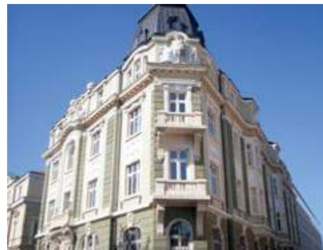
Жилищна сграда, София, 2019

From the moment of being declared capital of Bulgaria, Sofia saw a new central core being built to replace the by then abandoned Turkish houses. As a first step, already in 1878 the contender for the Bulgarian throne, Prince Alexander Dondoukov, ordered the demolition of almost all Muslim temples in Sofia. To avoid a diplomatic scandal, he waited until a particularly devastating thunderstorm hit the city to have their minarets blown up with dynamite. Then Russian engineers were hired to transform the konak (seat of the Ottoman authority), only recently