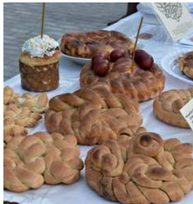
Великденски обреден хляб от село Минджур, Молдова, 2019 г.

Нематериалното културно наследство на Република Молдова включва също други живи елементи, играещи важна роля в предаването на знания и умения, наследени от миналите поколения, и в поддържане на социална сплотеност, които стимулират творческото начало и представляват по света