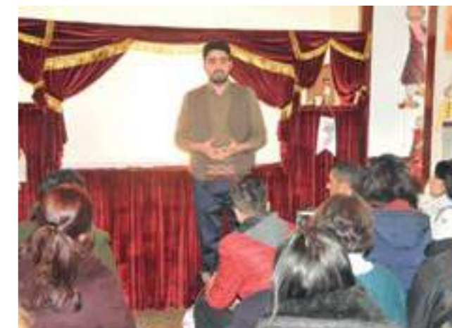
Учениците са информирани за кукленската традиция преди представянето в музея в Анкара

The Museum considers accessibility as a significant part of its function. In this context, Ankara Intangible Cultural Heritage Museum organizes events that bring people together to share stories, songs, tales, etc. As part of the mobile museum activities and with the aim of sustaining traditional children games, the Museum attended Ethnosport Cultural Festival (2016, 2017 and 2018) in Istanbul, the Harvest Festival (2017) and April 23 National Sover-