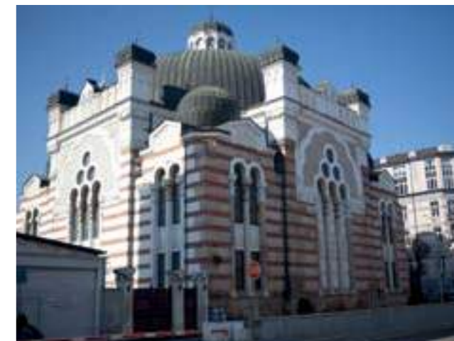
Синагога, София, 2019 The Synagogue, Sofia, 2019 Сн.: Лиляна Караджова / Ph.: Lilyana Karadjova

Queen Eleonora as patrons of the Church, both in full Byzantine regalia. The roof of the throne is topped with the Bulgarian royal crown.