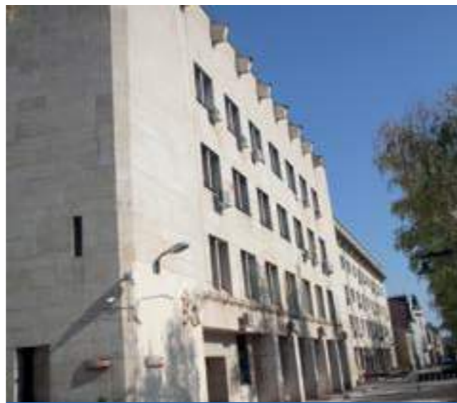
Министерство на вътрешните работи, София, 2019

След смъртта на Сталин комунистическите елити в Източна Европа са прочистени набързо и заменени с по-младо поколение комунисти. Това е вълна, която за дълго време поставя начело на властта в България Тодор Живков. Директивите от Москва по това време принуждават сателитните държави да се откажат, както от култа към личността на Сталин, така и от естетическите принципи на сталинската архитектура. Естествен резултат от това решение е постепенното връщане на архитектите към предвоенния прогресистки модернизъм. Много скоро се оказва, че плановата